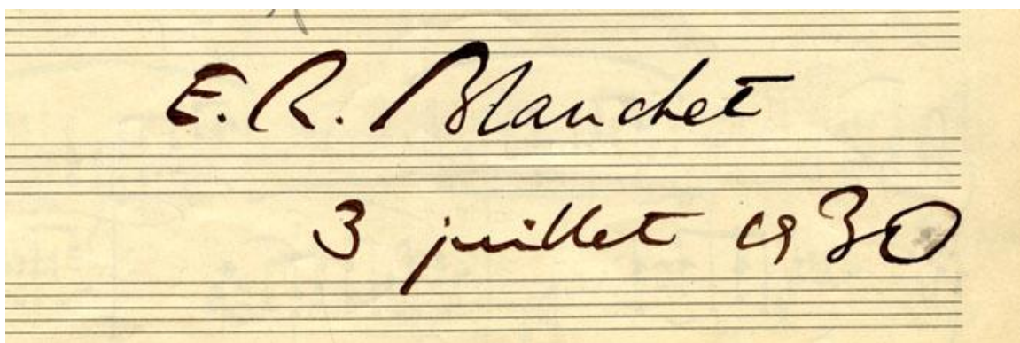
La signature de E.-R. Blanchet

Le Fonds contient 93 manuscrits, 5 esquisses, 7 recueils factices avec différentes pièces et les observations, les notes d'enseignement, le plan du travail et des pièces avec l'analyse harmonique.