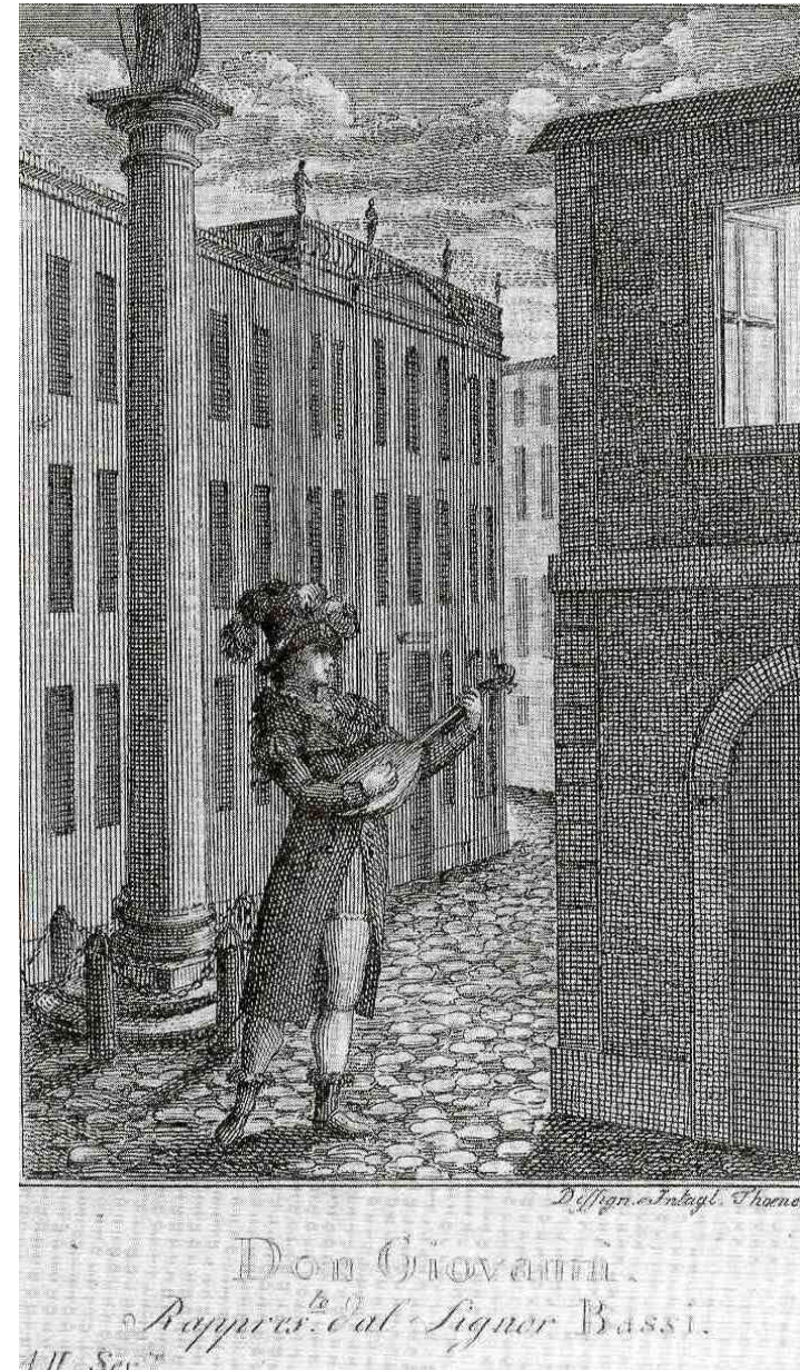
Luigi Bassi, créateur de Don Giovanni, dans une gravure de l'époque de la création

Chœur : paysans et paysannes ; serviteurs ; musiciens.